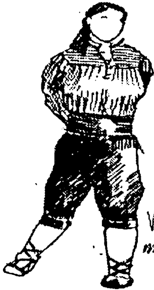
Vestit de gala maig 1997