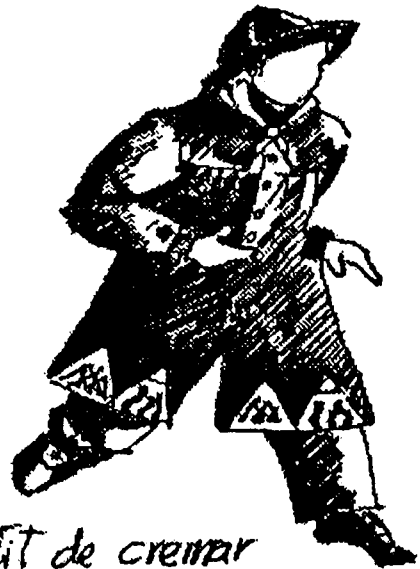
Vestit de cremar maig 1997