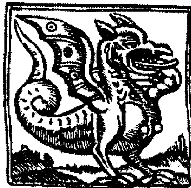
Víbria segons un auca del S.XVIII

VERTICALS: 1. Partícula inflamada que es desprèn d'un cos en combustió. Quan no la saps, no saps res de res.-2. Socors. Llengua Basca.-3. Matrícula d'una ciutat "non grata" pels seguidors madridistes. Lletre maleïda. Inhabitada.-4. Amb que es curaven els cops, els nostres avis?. Vocals.-5. Regne. Nota del traductor.-6. Lletre de Roma. Matrícula de Tarragona. Gegant dels contes de fades.-7. Profit que es pot treure d'una cosa. La meitat del "Pepe".-8. Esser fantàstic que es representa sota la figura d'una dona. Salvia Sclarea.-9. Model de cotxe que ven la Citroën. Forma del datiu o de l'acusatiu del pronom de primera persona. Que viu, que es troba, té lloc, en l'aire.-10. Metall pulverulent utilitzat en pirotècnia. Al revés, mascle de l'oca.